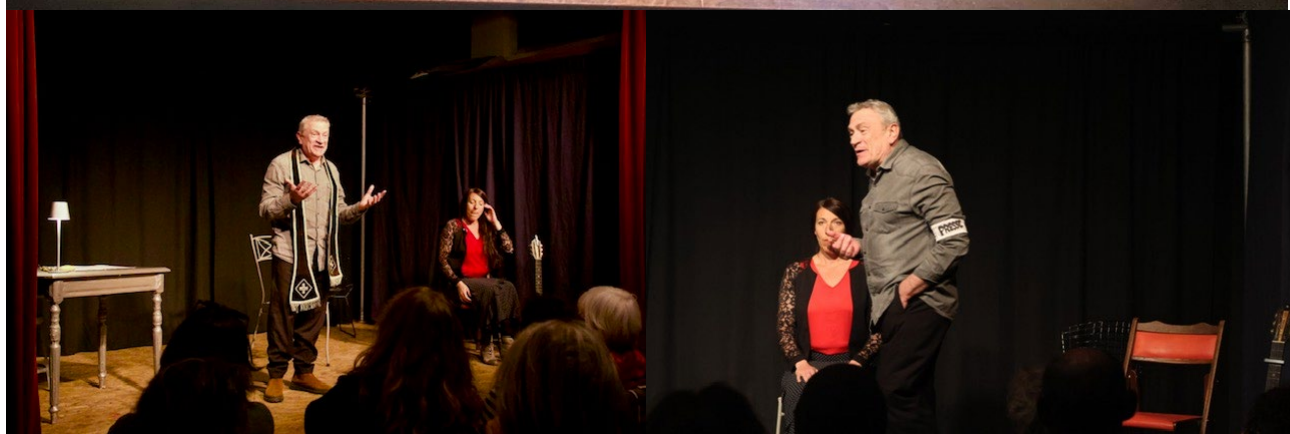
L'homme de l'église